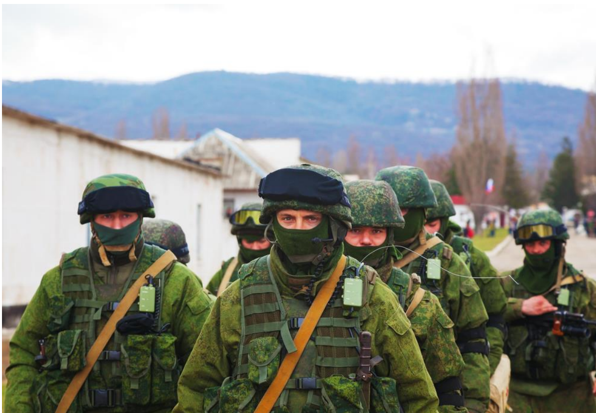
Orosz katonák vonulása Perevalnában, a Krimi-félszigeten, 2014. március 5-én.